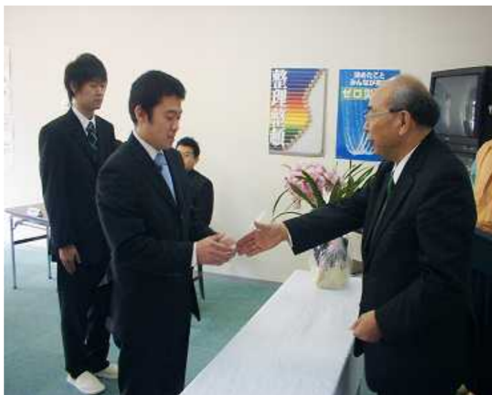
「辞令を受ける新入社員たち」

桜前線が北上する季節となり、当社では新卒者二名を迎えることとなり、三月二十六日午前豊岡本社会議室で、社長をはじめ幹部社員及び当日在社している社員が参加して入社式が行われました。