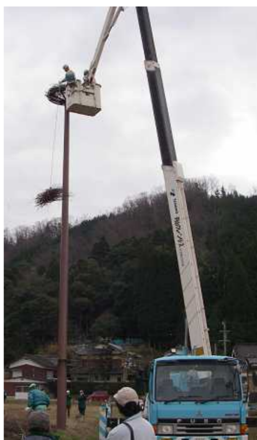
河谷地区で人工巣塔の上に巣材設置

昨年九月に人工飼育のコウノトリ四羽が近くの河谷放鳥拠点から放鳥され、コウノトリも繁殖シーズンに入ったことから人工巣を作るようになりました。当社は造園技術を生かして、こ