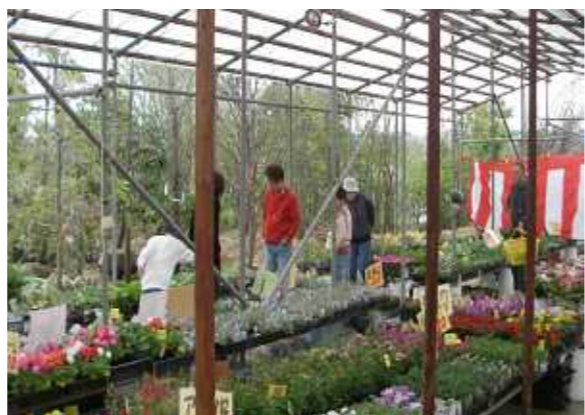
季節の花コーナー

お客様が来場されています。このイベントは、お客様から「豊岡市内に植木を見る場所が無い」との多くの声を聞き、植栽適期に毎年開催しているもので、毎回訪れるお客様も多く、地域に根ざしたイベントになってきています。是非ご来場下さいませようお待ちしております。