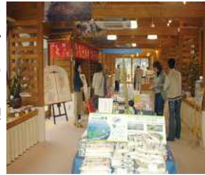
3月21日オープン「コウノトリ本舗」

当社の関連会社、有限会社晃が出資する「コウノトリ羽ばたく会株式会社」は、豊岡市が建設した地域交流センターの指定管理者となつて「コウノトリ本舗」と命名しました。環境と経済が両立を目指す試みとして、コウノトリの郷公園を訪れる多くの方々に地元産品や環境に優しい商品を提供し、情報発信する拠点として開設準備を進めていましたが、桜の便りが届きはじめて三月二十一日