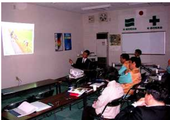
「熱心な参加者たち」

年度末が過ぎ、余韻が残る四月十三日、営業部門が主催し、多自然工法の研修を円山川沿いの豊岡本社会議室で社員十名と植生復元に興味のある地元の方数名が参加し、講師には、今後、多自然工法についての研究・普及にパートナーとして当社との共同